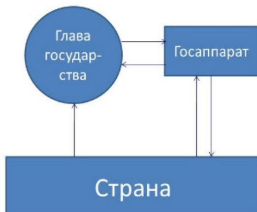
Obr.: schéma řízení země při absenci profesionálního konceptuálního (žrečeského) centra